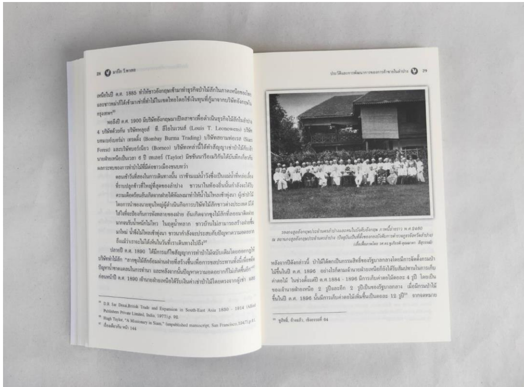
ภาพที่ 5 สถานกงสุลอังกฤษประจำนครลำปาง ภาพถ่ายเก่าหายากที่เผยแพร่เป็นครั้งแรก ในหนังสือลำปางเมื่อหัวหนึ่งศตวรรษ