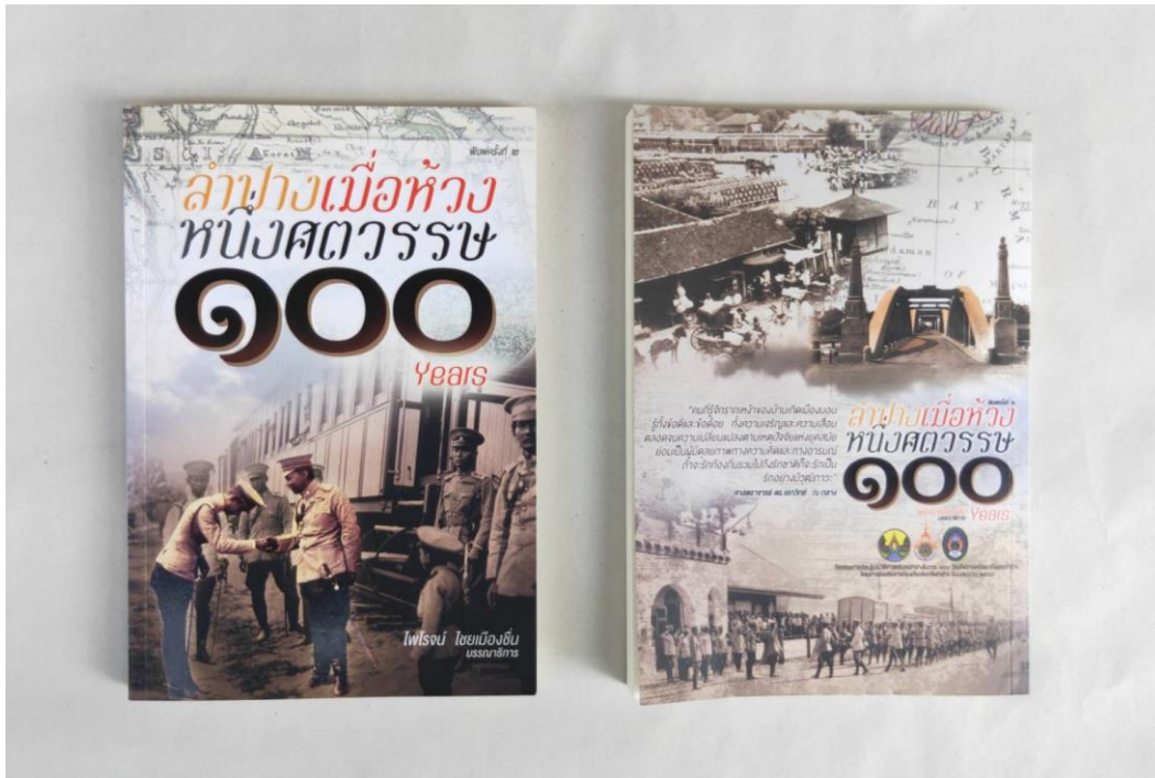
ภาพที่ 2 หนังสือเรื่อง “ลำปางเมื่อห้วงหนึ่งศตวรรษ” ฉบับพิมพ์ครั้งที่ 2 เมื่อปี พ.ศ.2559

เพื่อสร้างสรรค์หนังสือด้านประวัติศาสตร์ท้องถิ่นลำปาง โดยร่วมมือของเครือข่ายนักวิชาการท้องถิ่นให้เป็นเอกสารอ้างอิงทางวิชาการสำหรับเผยแพร่แก่สถาบันการศึกษาในจังหวัดลำปางและประชาชนทั่วไป