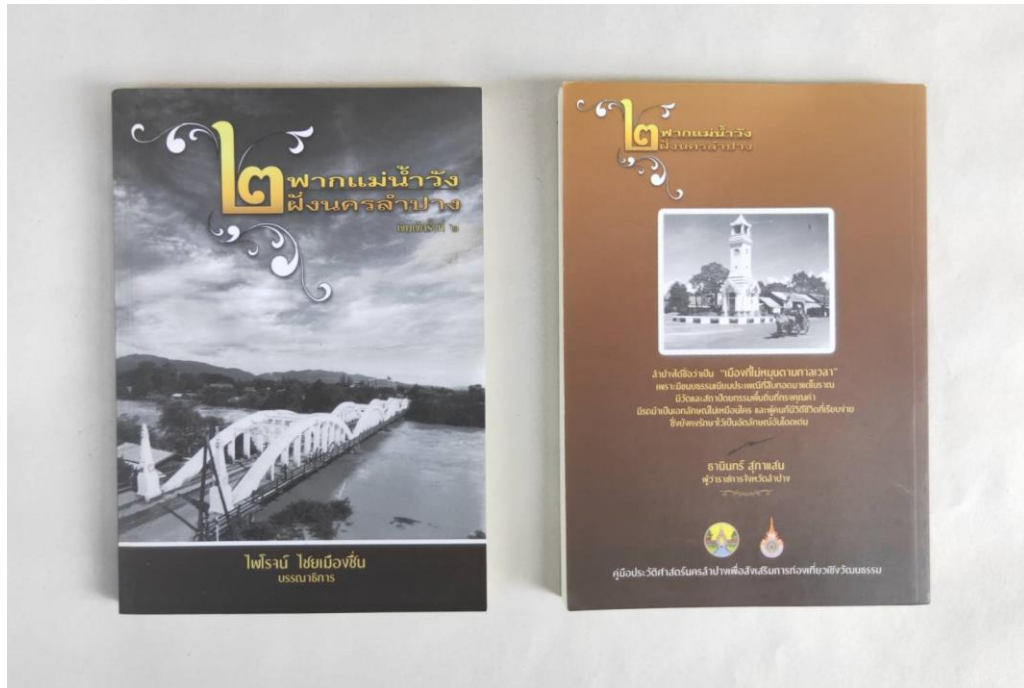
ภาพที่ 3 หนังสือเรื่อง “2 ฟากแม่บ้าน 2 ฟังนครลำปาง” ฉบับพิมพ์ครั้งที่ 2 เมื่อปีพ.ศ.2558